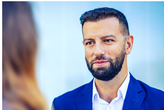
Serdar Arslan Expat & Relocation Service

T: +43 2742/9000-19716 E: internationalisierung@ecoplus.at W: www.ecointernational.at